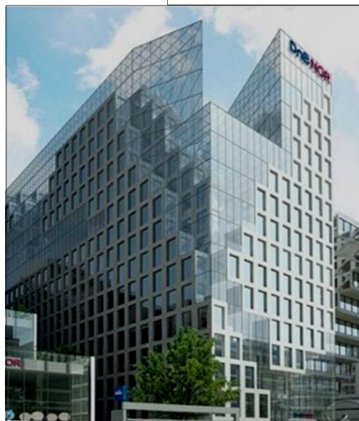
DnB Nors hovedbygning på 17 etager