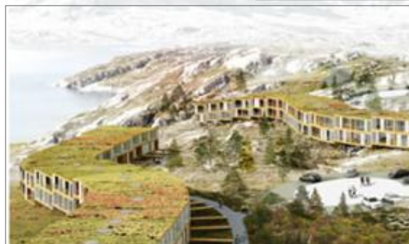
AI-Gruppens boligbebyggelse integreret i fjeldet